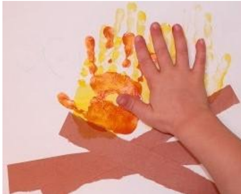
IMAGEM CARIMBO DAS MÃOS (FOGUEIRA).

PULA FOGUEIRA: https://www.youtube.com/watch?v=G1K95R8-sHI